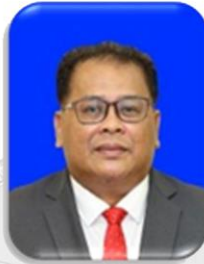
Datuk Abd Shukor bin Mahmood 13 Mei 2022 hingga kini