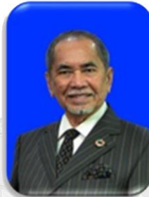
YB Dato Sri Dr. Haji Wan Junaidi bin Tuanku Jaafar 30 Ogos 2021 hingga kini