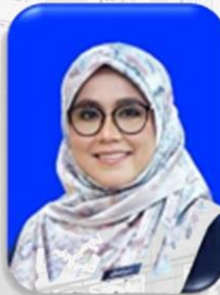
YB Datuk Haji Wira Hajjah Mas Ermieyati binti Samsuddin 30 Ogos 2021 hingga kini